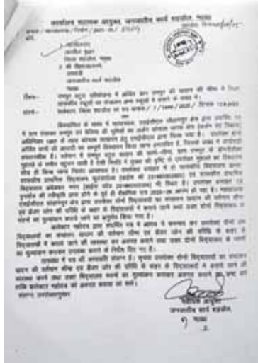
बार किसी तरह की गुंजाइश भी न बचे।