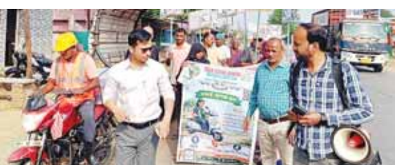
किया गया तथा उन्हें प्रेरित किया गया कि वे पेप के माध्यम से बुकिंग कर अपने शौचालयों की नियमित सफाई सुनिश्चित करें। ग्रामीण क्षेत्रों में स्थित कम्प्यूटिडि सेंटरों को भी शामिल

शहडोल। जिले की जनपद पंचायत सोहागपुर अंतर्गत ग्राम जमुई में मध्य प्रदेश शासन की महत्वाकांक्षी पहल वाँश ऑन व्हील को ग्रामीण स्तर पर बढ़ावा देने के उद्देश्य से एक जनसंस्कृता रैली का आयोजन किया गया। यह पहल ग्रामीण क्षेत्रों में स्वच्छता व्यवस्था को सुदृढ़ करने की दिशा में एक महत्वपूर्ण कदम साबित हो रही है। वाँश ऑन व्हील एक ऐसा डिजिटल टूल है, जिसके अंतर्गत एक मोबाइल एप्लिकेशन के माध्यम से व्यक्तिगत, सामूहिक एवं संस्थागत शौचालयों की सफाई सेवा घर-घर तक उपलब्ध कराई जा रही है। रैली का नेतृत्व डिप्टी कलेक्टर गैलेक्सी नागपुरे द्वारा किया गया। इस अवसर पर जनपद पंचायत सोहागपुर की टीम, ग्राम जमुई के सचिव, रोजगार सहायक, आशा कार्यकर्ता, महिला एवं बाल विकास विभाग के कर्मचारी तथा स्थानीय युवाओं ने उत्साहपूर्वक सहभागिता की। रैली के माध्यम से ग्रामीणों को वाँश ऑन व्हील एप्लिकेशन के उपयोग के प्रति जागरूक